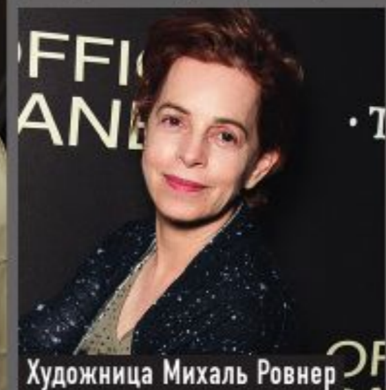
Художница Михаль Ровнер