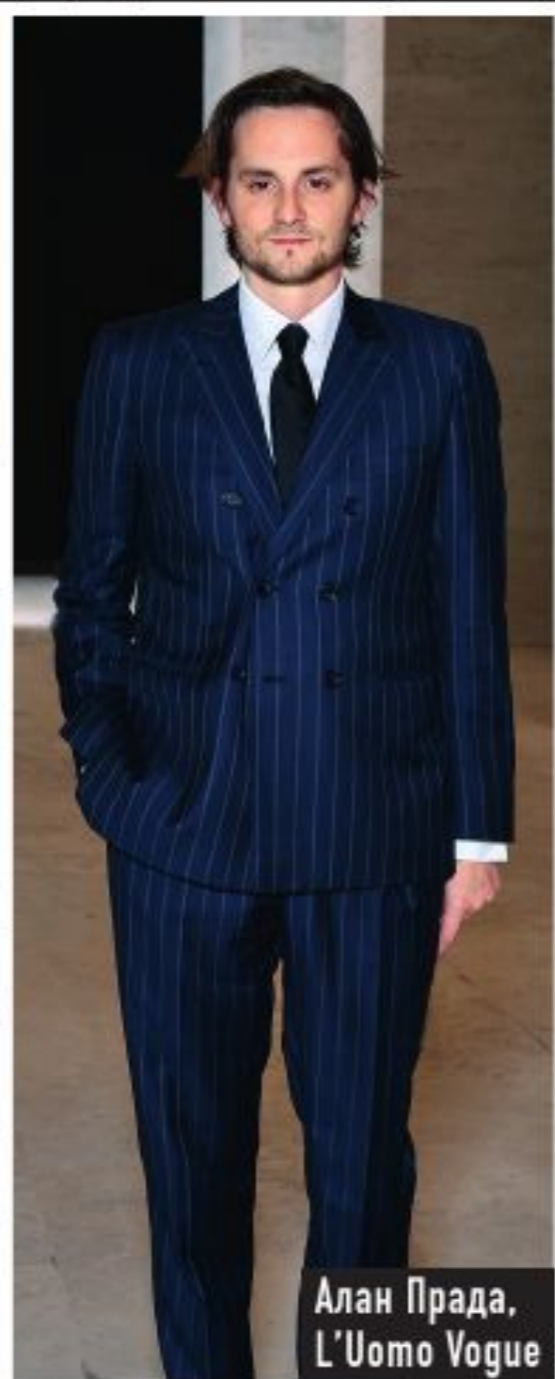
Алан Прада, L'Uomo Vogue