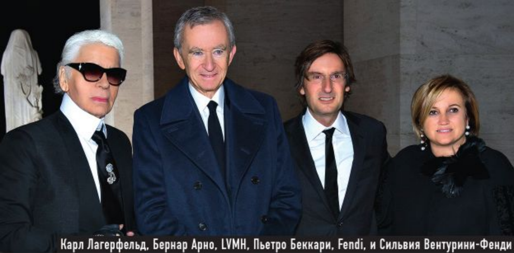
Карл Лагерфельд, Бернар Арно, LVMH, Пьетро Беккари, Fendi, и Сильвия Вентурини-Фенди