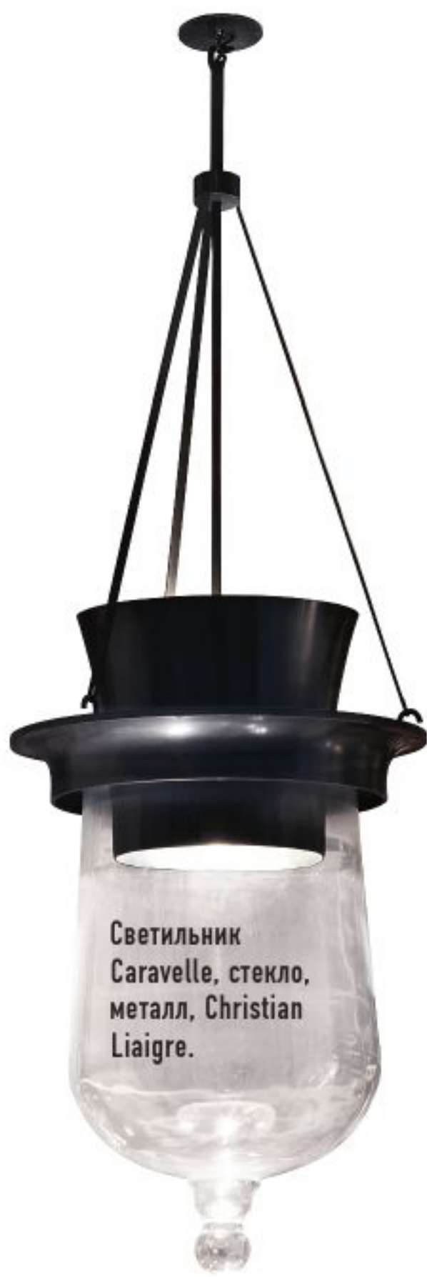
Светильник Caravelle, стекло, металл, Christian Liaigre.