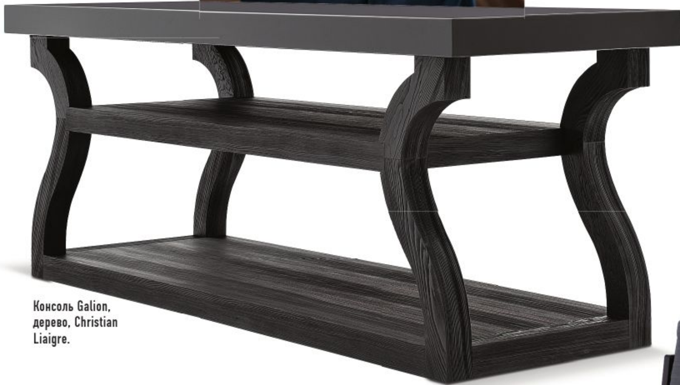
Консоль Galion, дерево, Christian Liaigre.