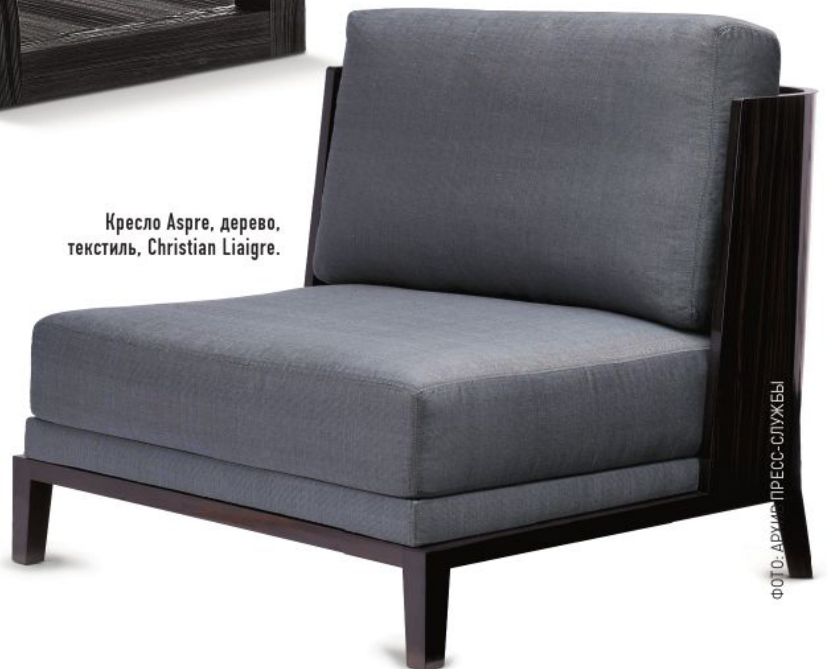
Кресло Aspre, дерево, текстиль, Christian Liaigre.

Сам Лиэгр считает себя скорее декоратором, чем дизайнером, мебелью занимается по необходимости, когда бессмертной классики больше не хватает. Он учился в парижской Академии искусств и великолепно рисует, так что любой его проект сопровождается огромным количеством ручных эскизов. Больше всего на свете ценит спокойствие (на время волнений в конце 1960-х бежал из Парижа в деревню, на запад Франции, не из политических пристрастий, а потому, что "в городе было так шумно"), и дизайн у него получается тоже молчаливый, строгий и основательный. Любимое дерево — черное и венге, любимый обивочный материал — крашеный лен. Кумиром своим считает меланхолика Альберто Джакометти.