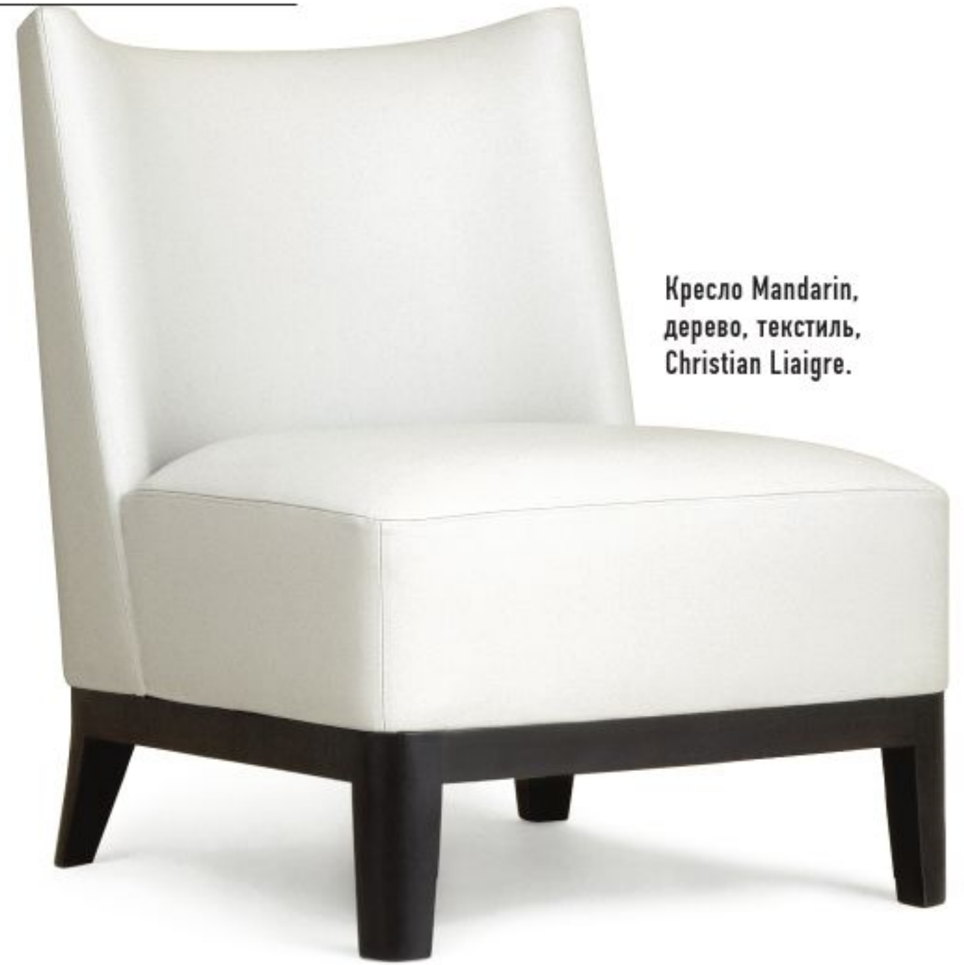
Кресло Mandarin, дерево, текстиль, Christian Liaigre.