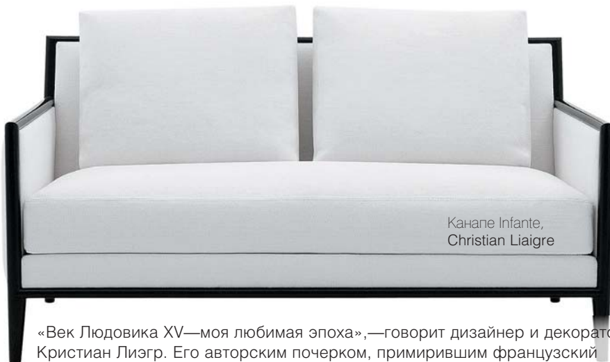
Canape Infante, Christian Liaigre

Начиная с этой осени интерьерный салон Fifth Avenue (Н. Сыромятническая, д. 10, стр. 2) представляет французскую марку Christian Liaigre