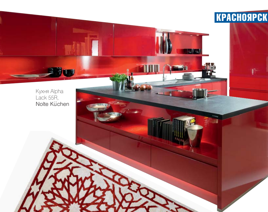
Кухня Alpha Lack 55R, Nolte Küchen

«Век Людовика XV—моя любимая эпоха»,—говорит дизайнер и декоратор Кристиан Лиэгр. Его авторским почерком, примирившим французский буржуазный шик и модернистский минимализм, отмечены и мебель, и интерьеры, созданные студией CHRISTIAN LIAIGRE. Среди крупных проектов—отель The Mercer в Нью-Йорке и универмаг Selfridges в Лондоне, в числе частных заказчиков—Карл Лагерфельд и Руперт Мёрдок. □