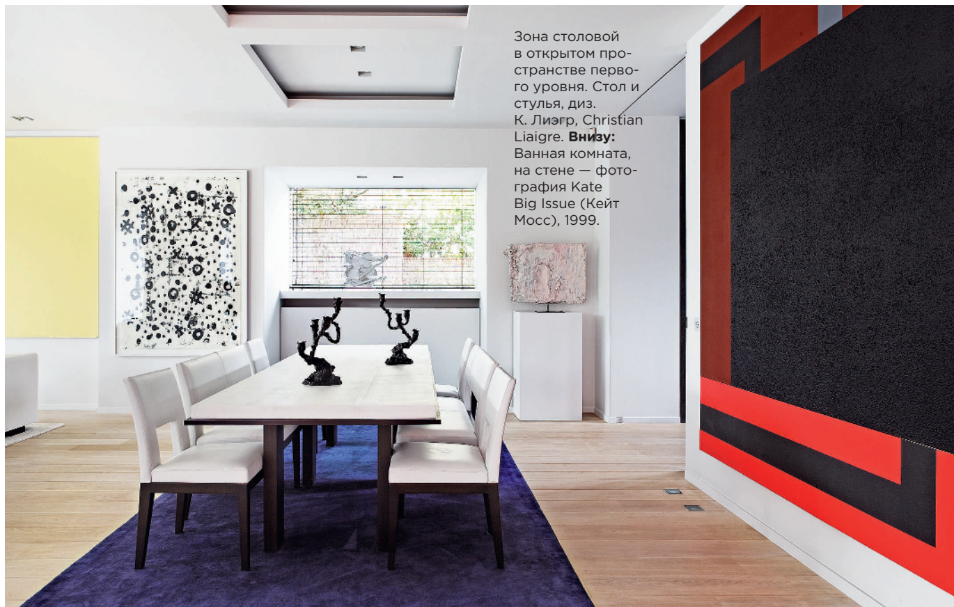
Зона столовой в открытом пространстве первого уровня. Стол и стулья, диз. К. Лиэгр, Christian Liaigre. Внизу: Ванная комната, на стене — фотография Kate Big Issue (Кейт Мосс), 1999.