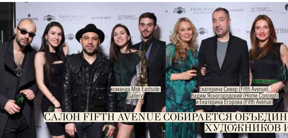
команда Msk Eastside Gallery