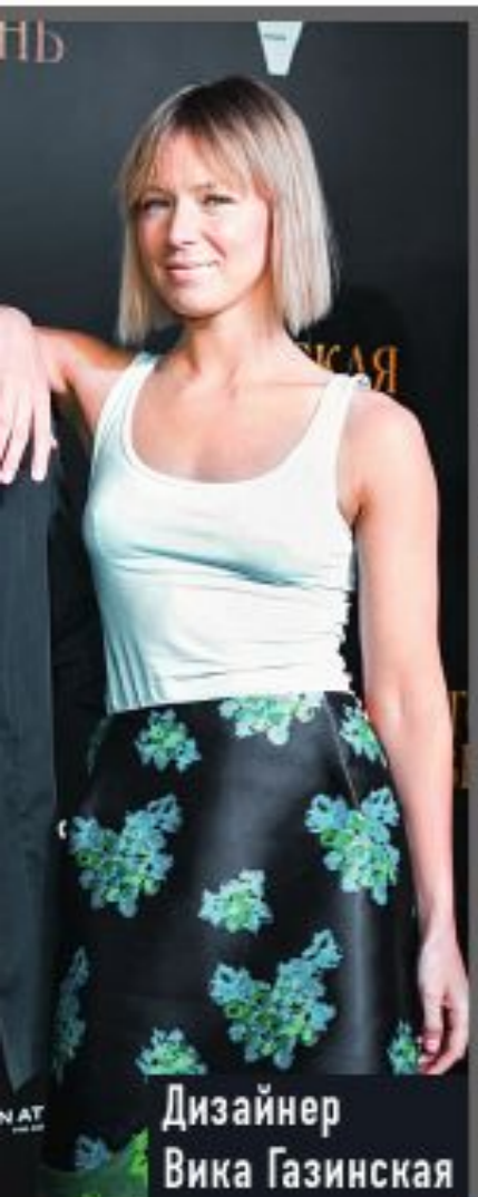
Дизайнер Вика Газинская