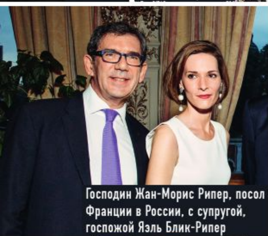
Господин Жан-Морис Рипер, посол Франции в России, с супругой, госпожой Яэль Блик-Рипер